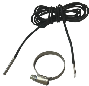
2 pav./figure 2