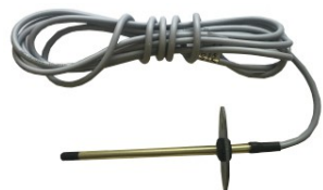
2 pav./figure 2