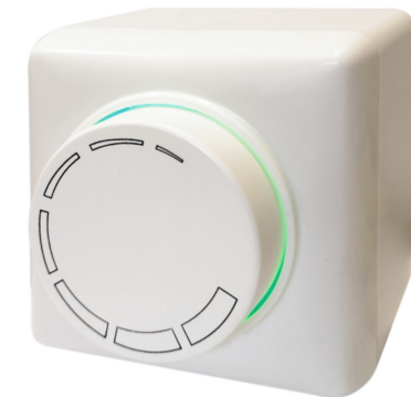
3 pav./рисунок 3/figure 3